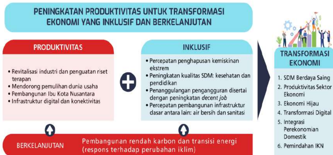
Gambar 3.1. Kerangka Pikir Tema RKP Tahun 2023

“Peningkatan Produktivitas untuk Transformasi Ekonomi yang Inklusif dan Berkelanjutan.”