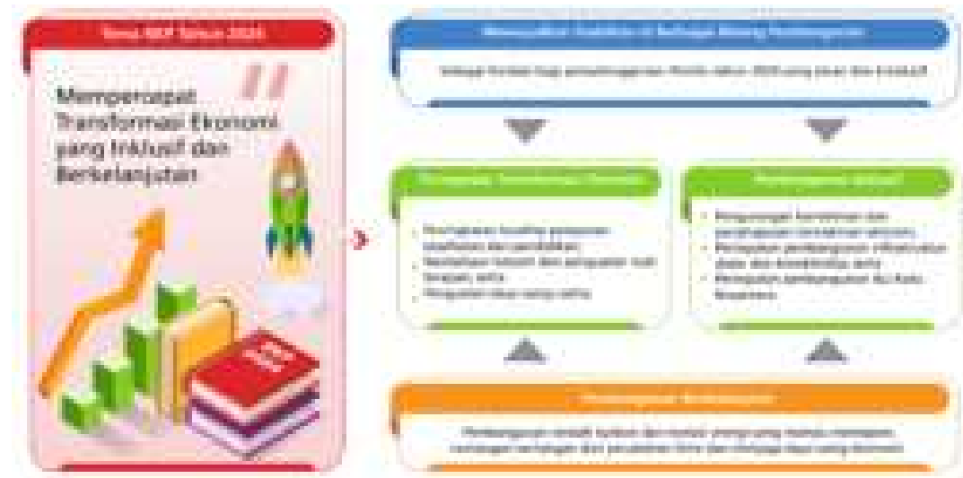
Gambar 3.1. Kerangka Pikir Tema RKP Tahun 2024

Tema RKP diarahkan untuk menjaga kesinambungan dan konsistensi pembangunan tahunan, serta sebagai upaya untuk membaurkan dinamika perubahan lingkungan yang terjadi secara tahunan ke dalam skenario pembangunan dalam RKP, dengan tetap memperhatikan koridor RPJMN. Untuk menjaga kesinambungan dan konsistensi antara pembangunan tahun 2023-2024, maka tema pembangunan RKP Tahun 2024 ditetapkan yaitu "Mempercepat Transformasi Ekonomi yang Inklusif dan Berkelanjutan". Secara visual, kerangka pikir tema dimaksud ditunjukkan sebagai berikut.