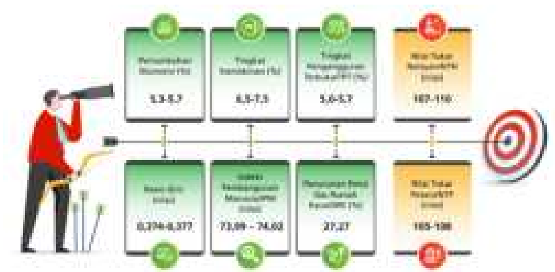
Gambar 3.2. Sasaran dan Indikator Pembangunan RKP Tahun 2024